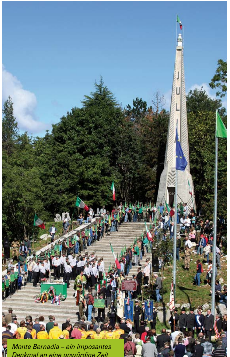
Monte Bernadia – ein imposantes Denkmal an eine unwürdige Zeit