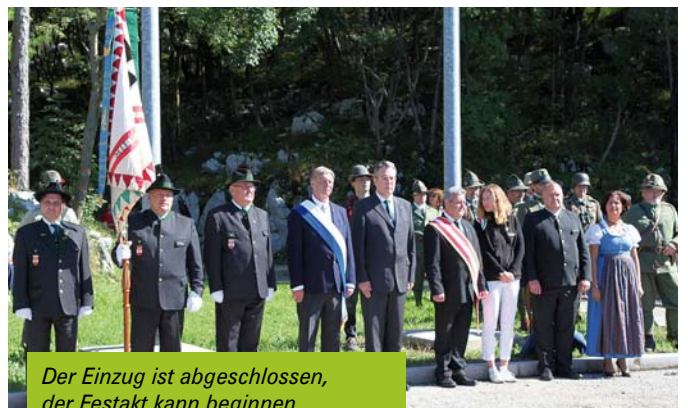
Der Einzug ist abgeschlossen, der Festakt kann beginnen