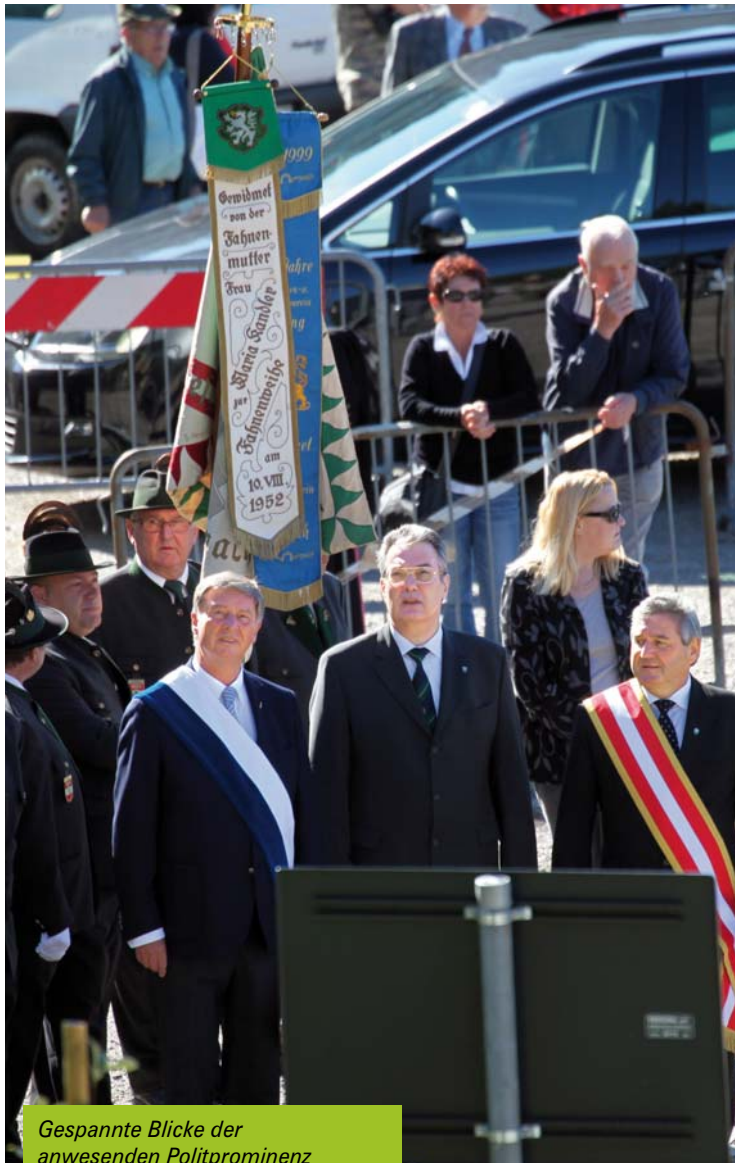
Gespannte Blicke der anwesenden Politprominenz