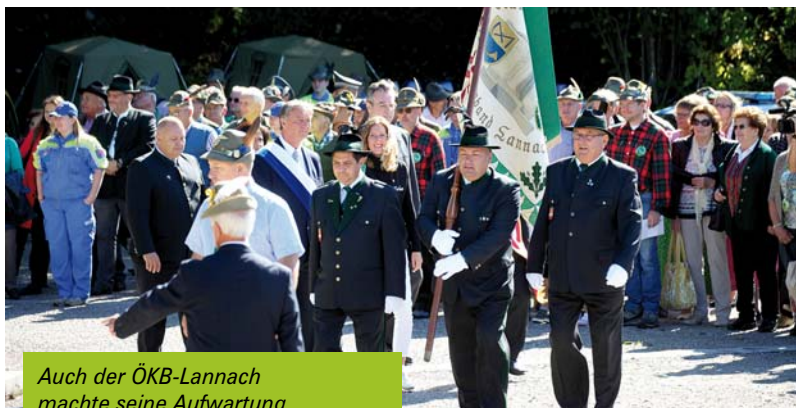
Auch der ÖKB-Lannach machte seine Aufwartung